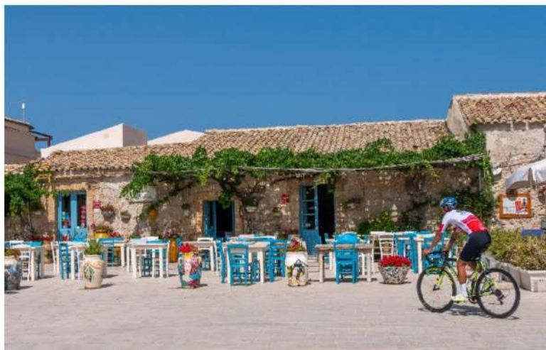
Ciclismo: il nuovo "Giro della Sicilia" tra Siracusa e Ragusa

Dall'11 al 17 settembre prossimi l'isola ospita la terza edizione del "Giro della Sicilia"