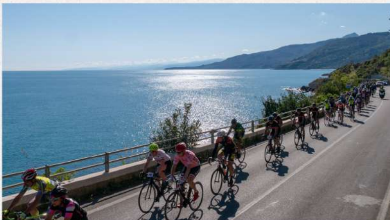
Iscrizioni già aperte per il Giro di Sicilia

DALL' 11 AL 17 SETTEMBRE IL GIRO DI SICILIA