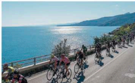
Terza edizione. Per la prima volta la manifestazione sportiva sceglie di addentrarsi e scoprire la terra barocca dopo che le altre due edizioni avevano coinvolto l'area centro occidentale dell'isola.